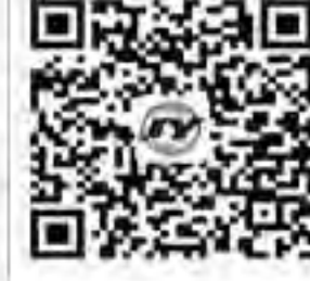
集团公司 公众微信账号