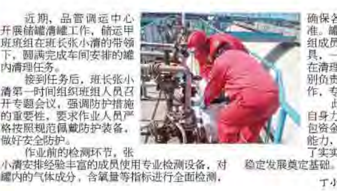
为确保各项指标均符合安全作业标准。罐内清理工作难度不小，但班组成员没有丝毫退缩，他们手持工具，一铲一铲地将铁锈清理下来。在清理过程中，大家分工明确，分别负责清理、运输、安全监督等工作，专注认真，配合默契。